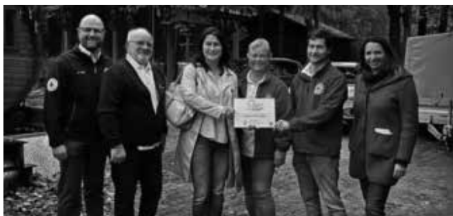
In Ebermannstadt konnte die Wasserwacht im Jahr 2025 dank dem Regionalbudget ihr Gelände neu gestalten

Alle Projekte stellen wir auf www.ile-fsa.de vor.