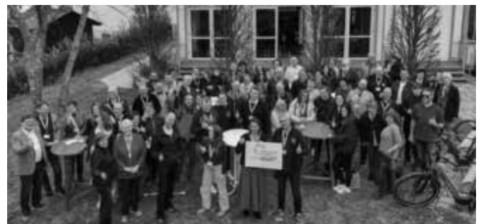
Im Jahr 2025 fand der 1. Vereinstag mit 70 Teilnehmenden aus 12 Kommunen in Ebermannstadt statt

Samstag, 9. Mai von 9 - 16 Uhr Burg Waischenfeld